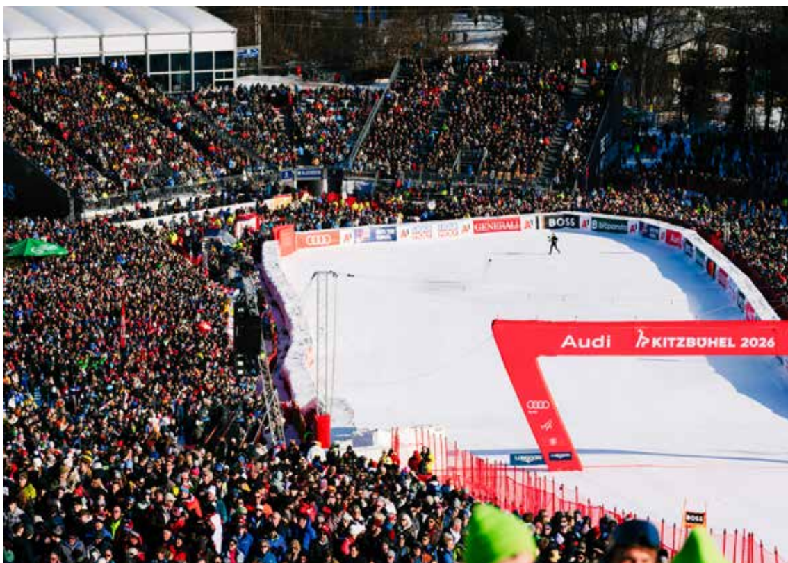
WC Kitzbühel.

Som i tidligere sesonger var det også betydelig fokus på landslagsmodellen og uttak. Flyttingen av junior-VM fra Trondheim til Lillehammer skapte også omfattende omtale, særlig i regionale medier. I tillegg fikk saker knyttet til TV-rettigheter og endringer i trener-team mye oppmerksomhet.