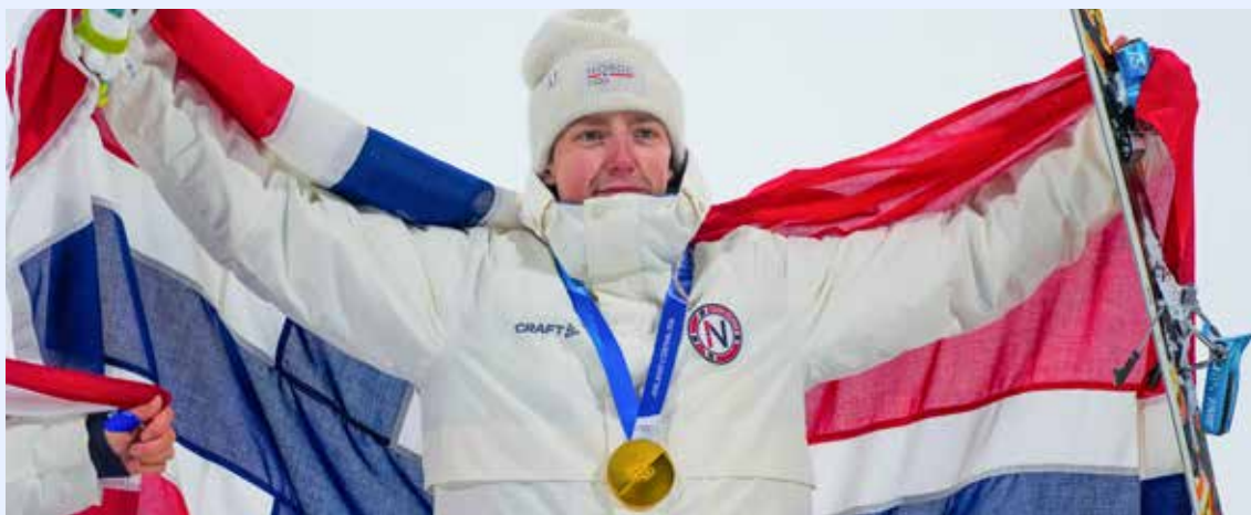
Tormod Frostad med OL-gull.

6.-10. april arrangerte vi Euroacup i Big Air og Slopestyle i Trysil. Med god planlegging og gjennomføring i tett samarbeid med Trysil IL, Skistar Trysil, FIS og Norges Skiforbund Freeski ble det et svært vellykket arrangement. Vi arrangerte både Slopestyle og Big Air, og hadde med oss 60 herrer og 11 damer. Deltakerne kom fra hele 14 nasjoner: Norge, Sverige, Danmark, Finland, Sveits, Frankrike, USA, Slovakia, Polen, Litauen, Latvia, Storbritannia, Thailand og Island.