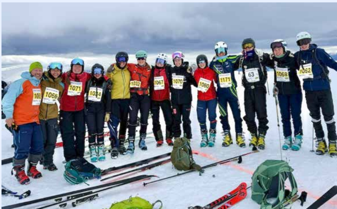
NM Fjelltelemark på start – toppen av Kjerंगा-fjellet 1314 moh. i Leikanger.

https://www.skiforbundet.no/hedmark/nyhetsarkiv/2026/2/skisprell-telemark-i-trysil/