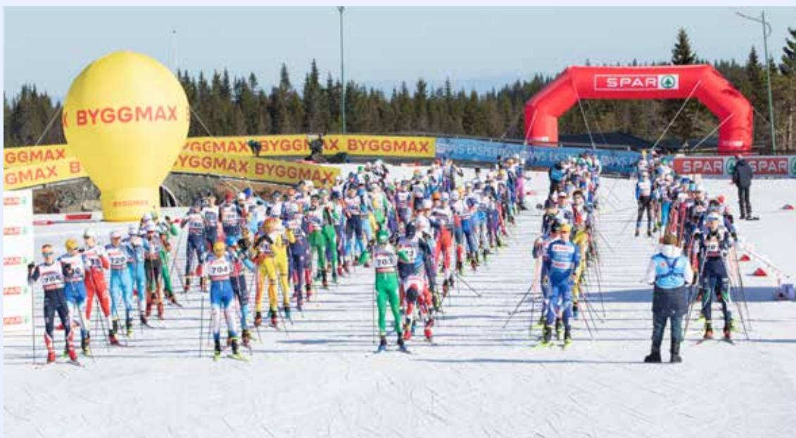
SPAR Norgescup Lygna.