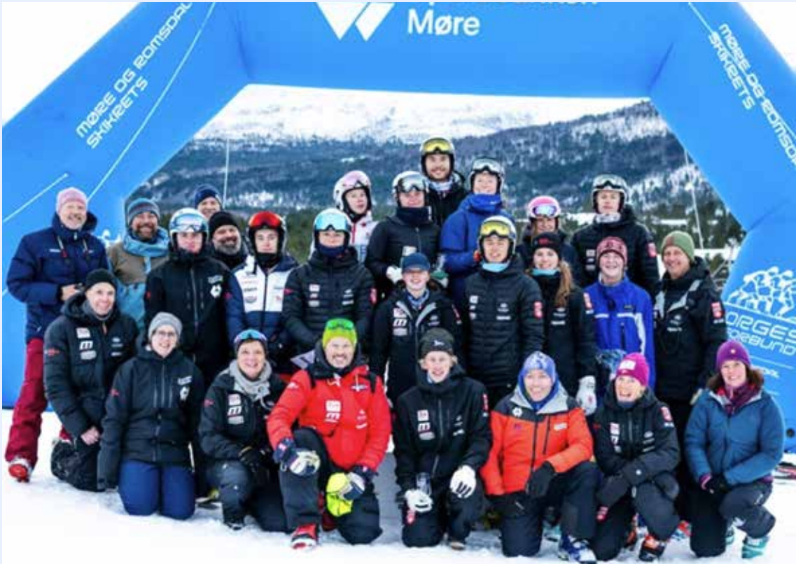
Det norske juniorlandslaget samlet under premieutdelingen for seier i team-sprinten.