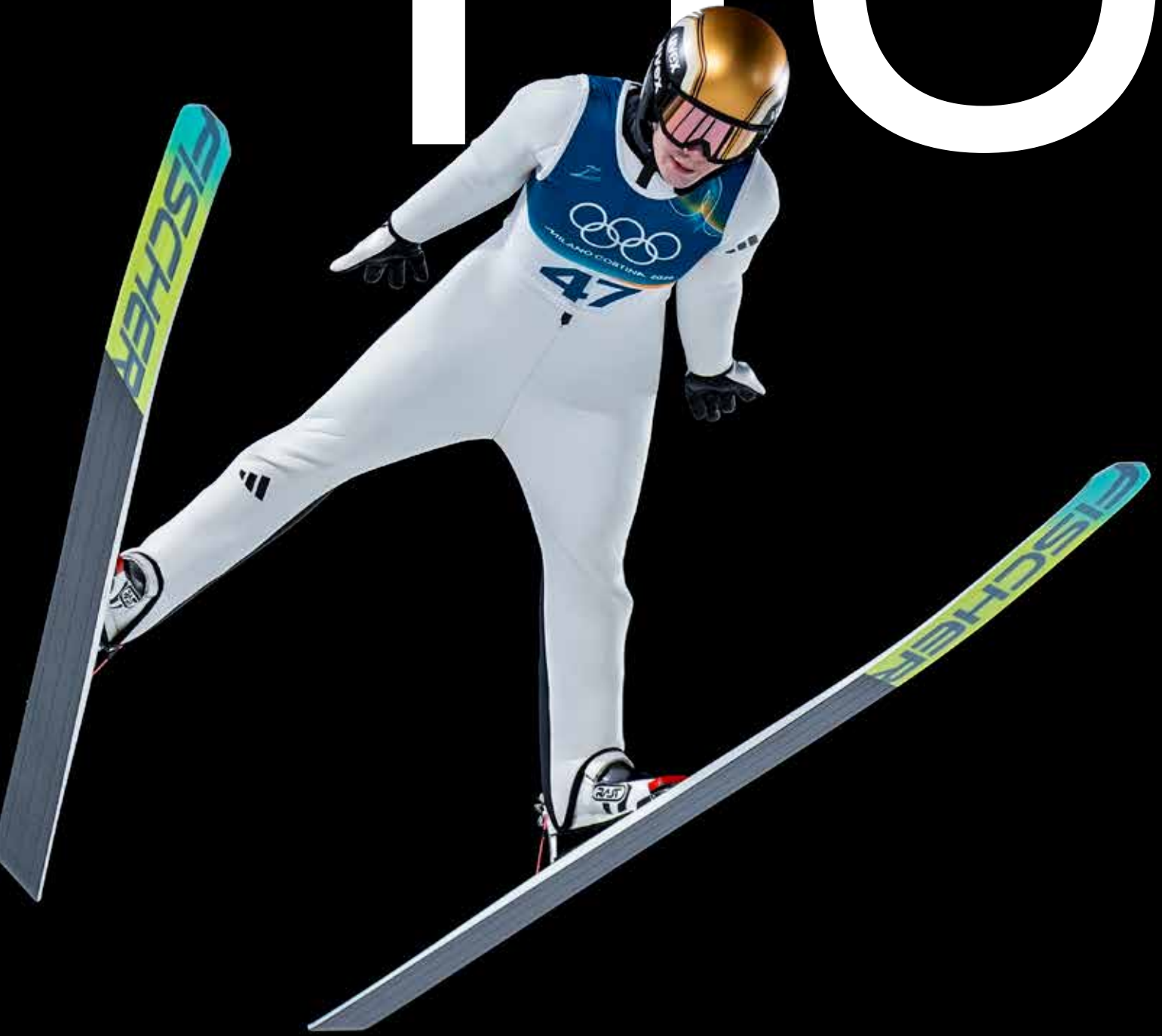
Val di Fiemme 20260207. Norges Anna Odine Strøm i prøveomgangen for normalbakke individuell for kvinner i Predazzo Ski Jumping Stadium under Vinter-OL i Milano Cortina 2026.