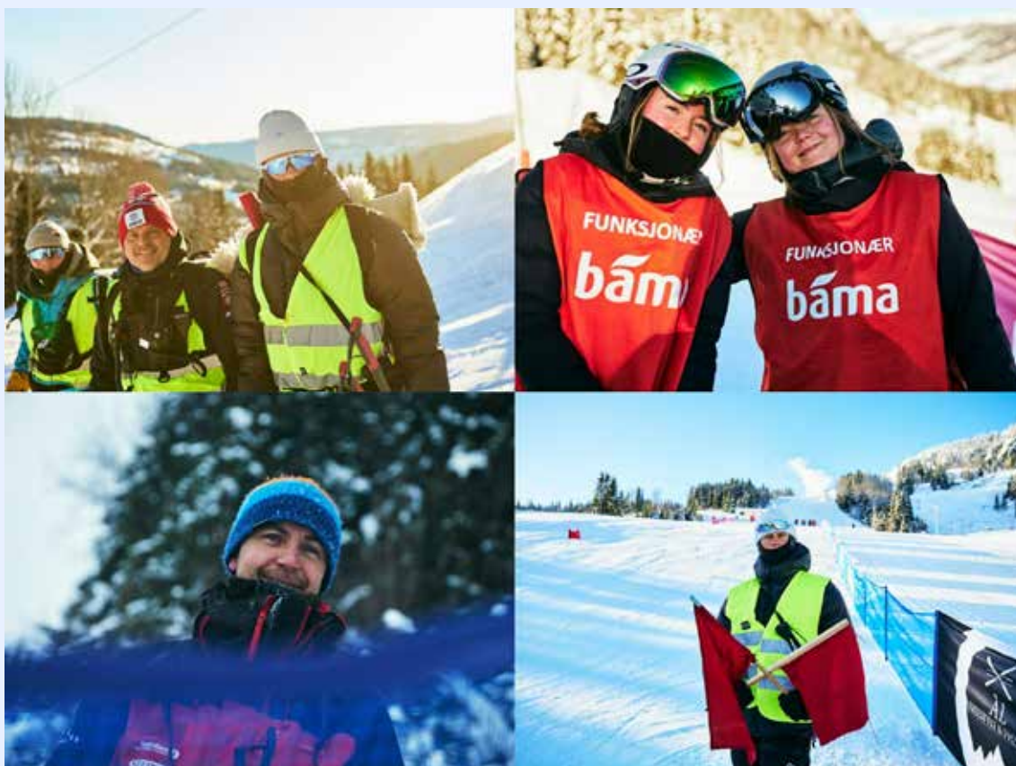
Telemark og skiglede.