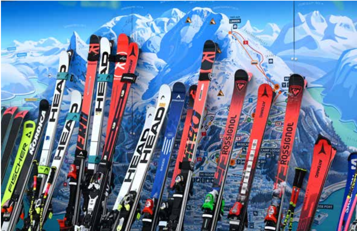
Fra junior-VM alpint i Narvik.