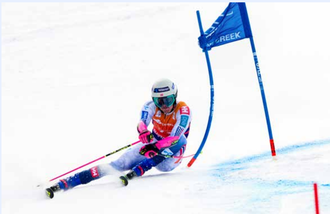
Norway's Eirik Hystad Solberg competes during a World Cup men's giant slalom skiing race, Sunday, Dec. 7, 2025, in Beaver Creek, Colo.