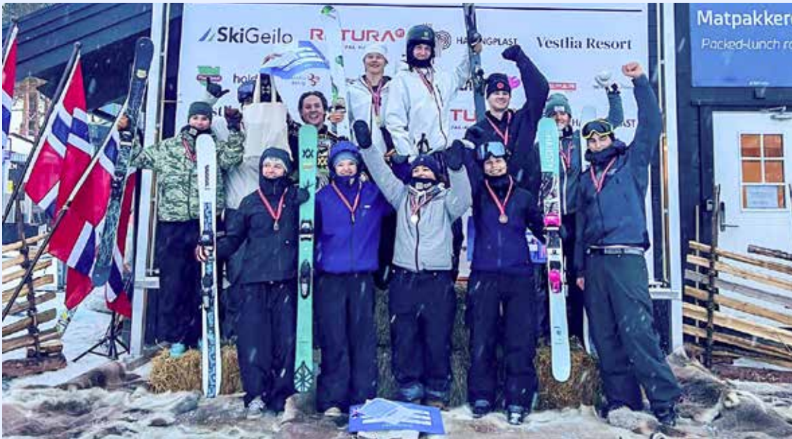
NM Geilo Big Air.

NOR Freeski Cupen hadde åpent for deltakere fra 14 år og oppover (det vil si utøvere født i 2012, som fyller 14 år i løpet av 2026). Det ble konkurrert i både junior- og seniorklasser for gutter og jenter gjennom sesongen. Avslutningen fant sted med et vellykket Norgesmesterskap på Geilo. Dessverre var det få fra elitelandslaget som fikk til å stille i år grunnet en hektisk World Cup-kalender kombinert med OL, men Birk deltok i Big Air. Hovedlandsrennene var åpne for utøvere født i 2012 og 2013.