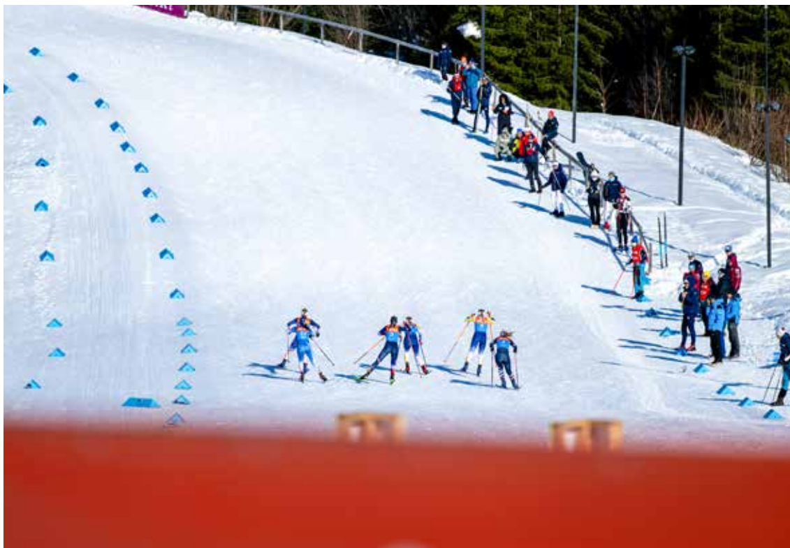
U23-VM Lillehammer langrenn, sprint fri teknikk.

Det har vært et tett og godt samarbeid med grener, kretser, NIF og andre særforbund gjennom hele året.