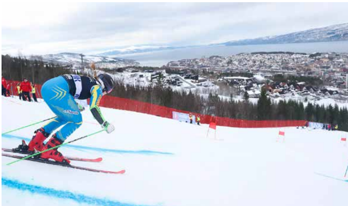
Fra junior-VM i alpint Narvik.

NSF har ikke påtatt seg noe ansvar for anleggsinvesteringer, hverken for fremdrift eller for å skaffe finansiering. Som arrangør er NSF, Narvik kommune og arrangørselskapet, LOC'et, allikevel ansvarlig for at mesterskapet gjennomføres i henhold til kravene i Hosting Agreement.