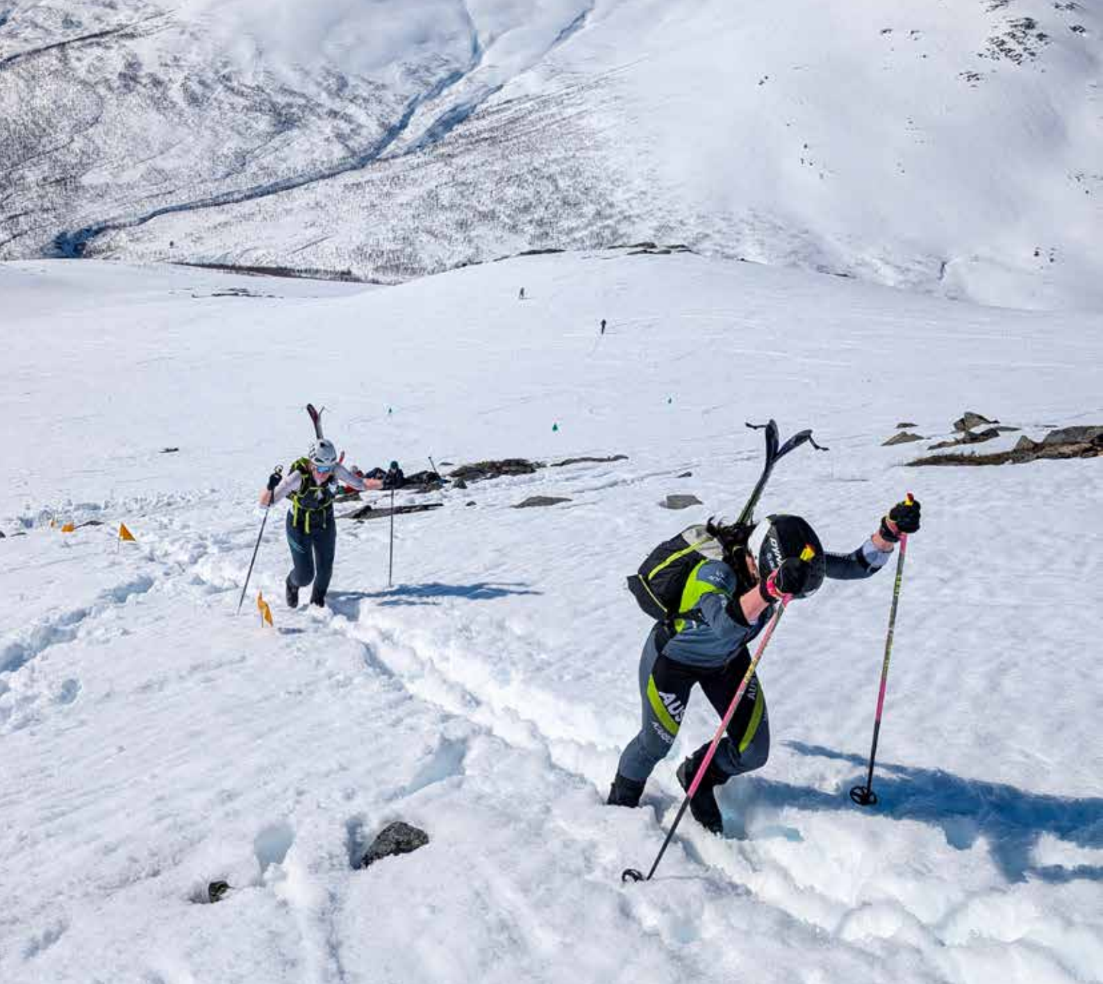
Bardu Rando.