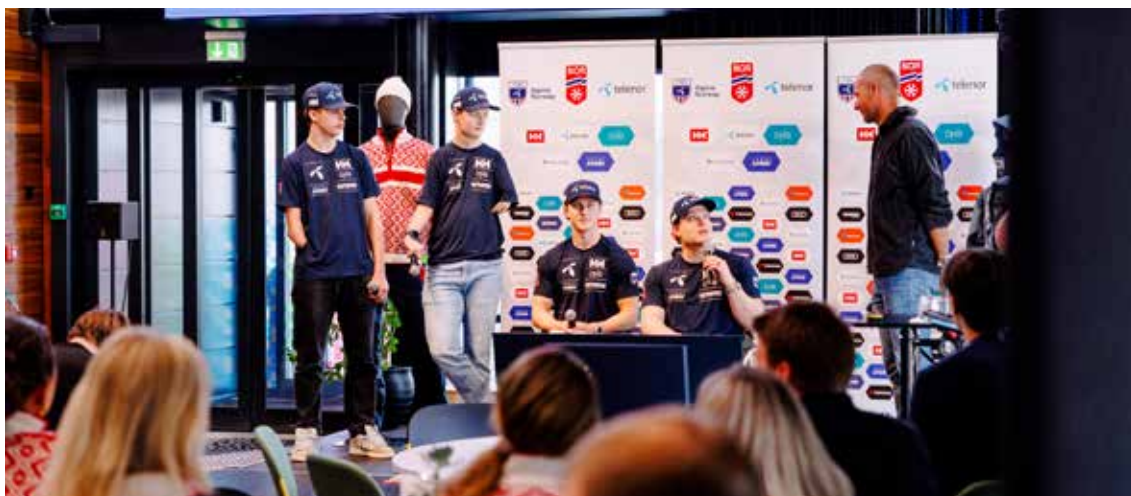
Alpinlandslaget samlet til Kick Off og mediedag for ny sesong.

Det ble gjennomført en rekke mediemøter, både fysisk og digitalt, og avdelingen bistod Skiforbundets grener og fellesadministrasjon løpende gjennom sesongen. Interessen for norsk skisport er fortsatt høy, særlig for langrenn som er den klart største mediedriveren.