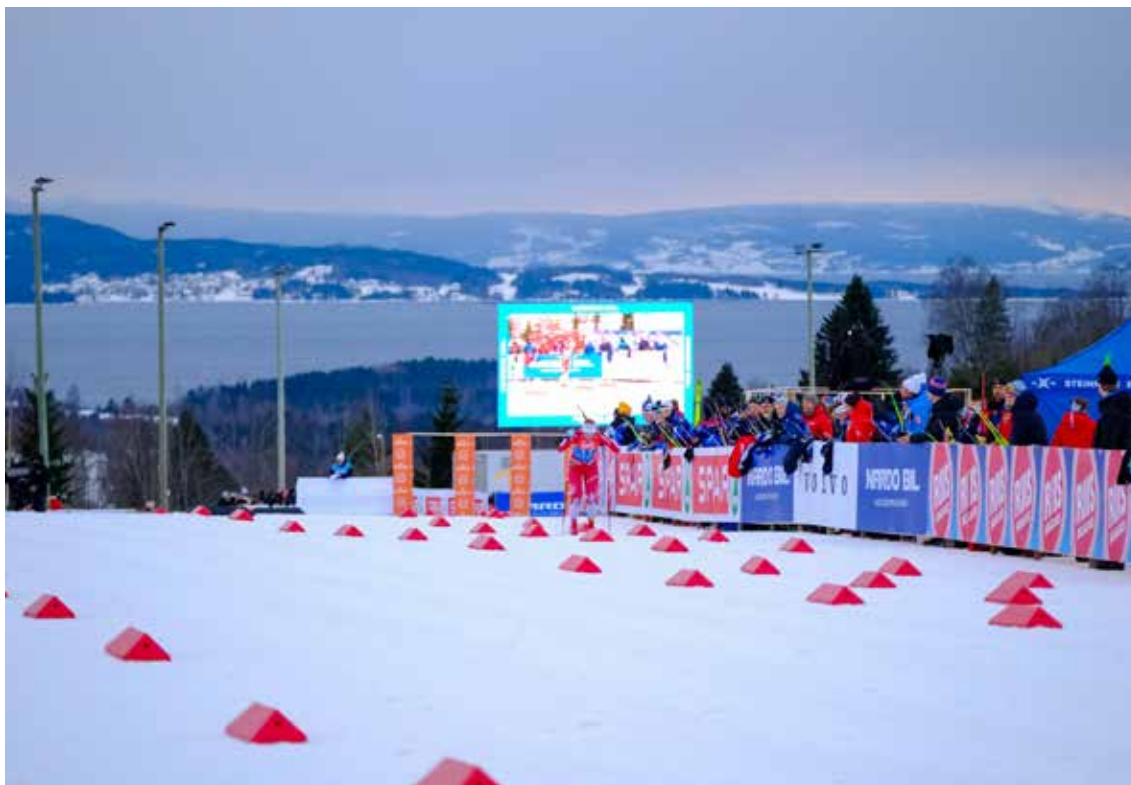
SKI-NM Steinkjer.

Også i år har NSF Arrangement bestått av et riggteam bestående av åtte personer i deltidsstilling. Dette er et team som kan arrangement og får gjort oppgavene ordentlig slik at vi får best mulig tv-bilder.