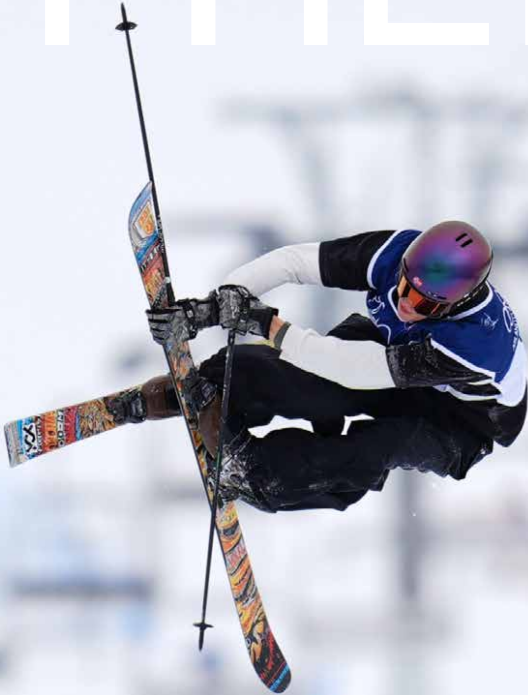
Norway's Sebastian Schjerve competes during the men's freestyle skiing slopestyle finals at the 2026 Winter Olympics, in Livigno, Italy, Tuesday, Feb. 10, 2026.