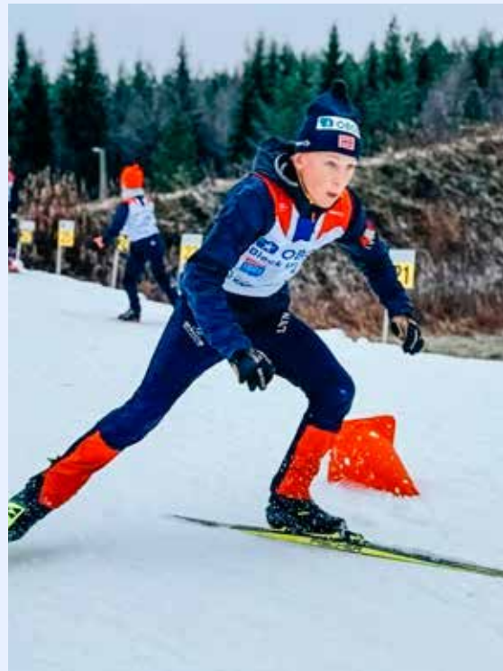
Rekruttering Trusil. Young Stars miljøsamling på snø for gutter og jenter.