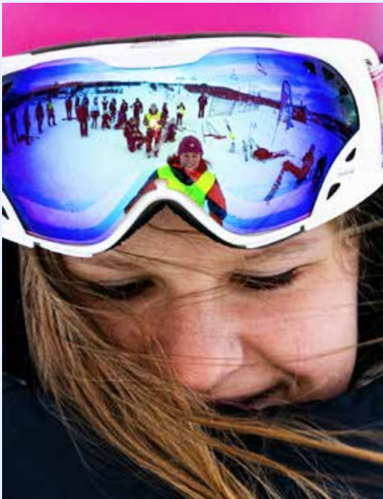
Telemark og skiglede.