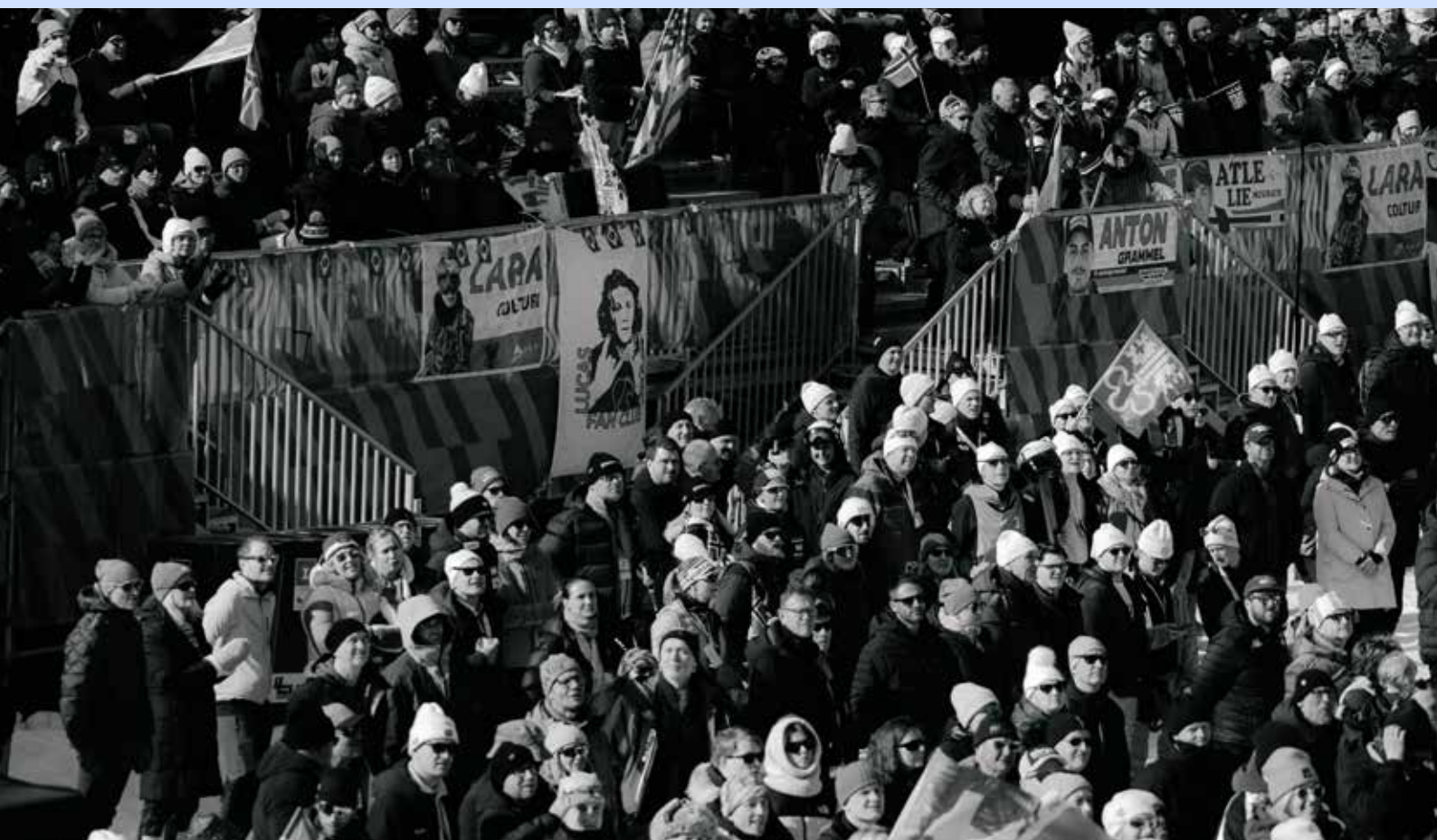
World Cup-finale Hafjell.