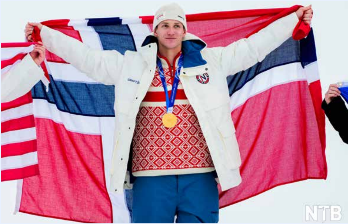
Birk Ruud med OL-gull.