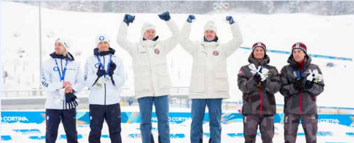
Val di Fiemme, Italia 2026. Sølvvinnerne Ilkka Herola og Eero Hirvonen fra Finland gullvinnerene Jens Lurås Oftedal og Andreas Skoglund fra Norge og bronsevinnerne Stefan Rettenegger og Johannes Lamparter fra Østerrike på pallen etter kombinert lagsprint 2 x 7,5 km Tesero CC-Stadium under vinter-OL i Milano Cortina 2026.