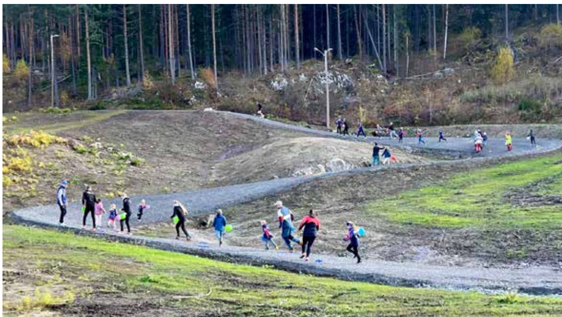
Nærmiljøanlegg, Moltemyra i Hallingby.

Samarbeidet mellom forbund, grener, kretser og klubber har vært et viktig premiss for å lykkes, og det er gjennomført tiltak og prosesser som skal bidra til mer helhetlig oppfølging og erfaringsdeling. På tvers av grenene har det vært fokus på rekruttering og frafall, samt å legge til rette for at flere blir værende lengre i idretten – både som utøvere og frivillige. Aktivitetstall for 2025 foreligger ikke på rapporteringstidspunktet. Tallgrunnlaget ferdigstilles normalt først etter sommeren, når endelig uttrekk og kvalitetssikring er gjennomført.