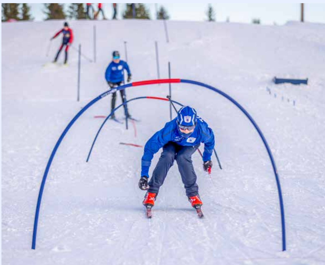
Skileik er viktig i barn- og ungdomsårene.

Frivilligheten er avgjørende for breddeidretten i langrenn. Det er lagt ned stor innsats fra trenere, tillitsvalgte og arrangører over hele landet. Gjennom UNG frivillig, som er en viktig satsning i Rekrutteringsklubben, gir langrenn utvalgte ungdommer et tilbud om økt kompetanse og oppfølging slik at de føler trygghet til å bidra aktivt i sine klubber.