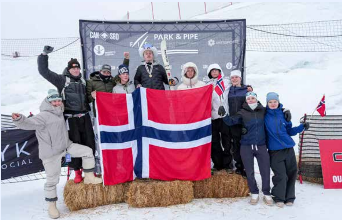
Den norske troppen under junior-VM.