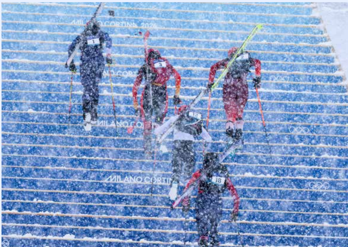
Randonee fikk sin OL-debut i Milano Cortina.