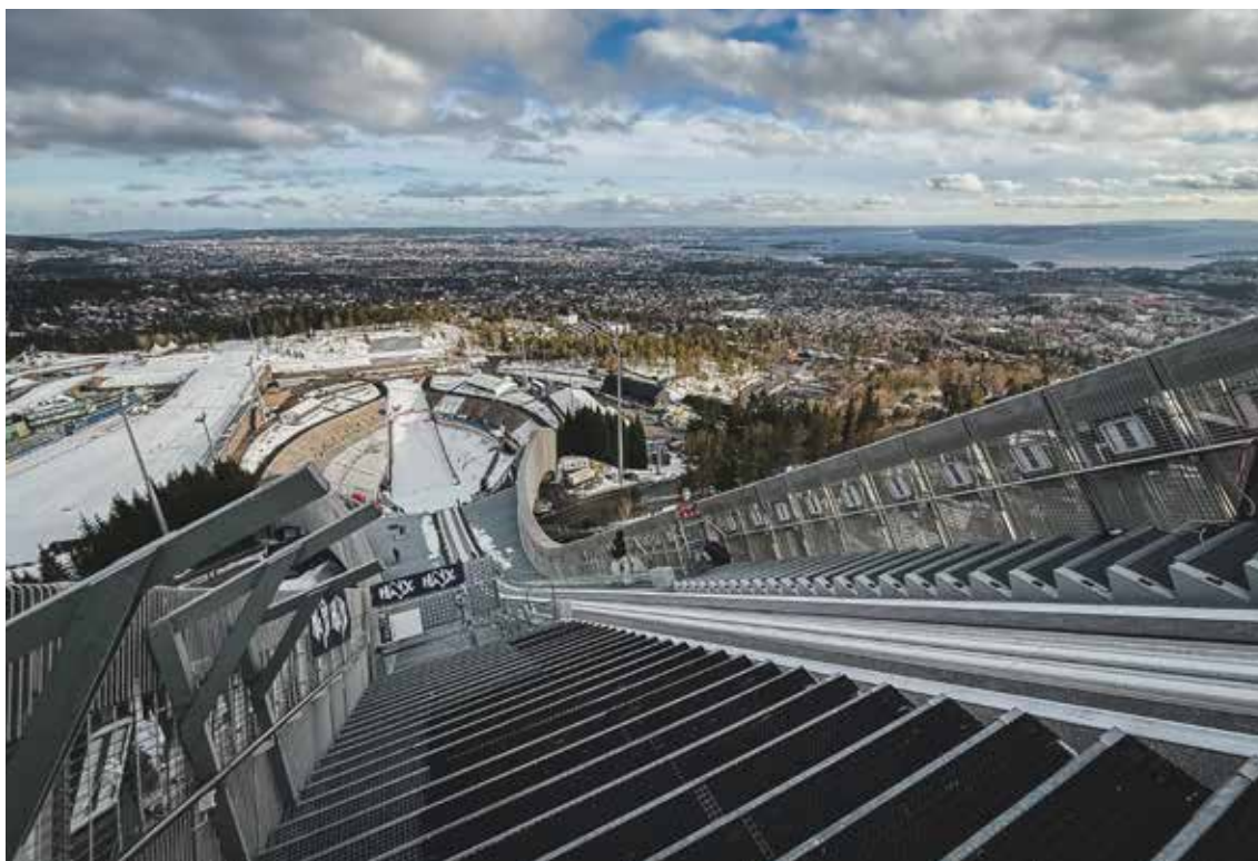
World Cup i Holmenkollen.

Siden høsten 2024 har NSF deltatt i høringsrunder for å gi innspill til KUDs forslag til nye nasjonalanleggsavtaler. Ny ordning ble presentert høsten 2025. Selv om KUD opprinnelig