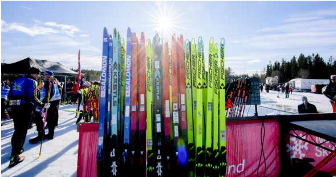
Junior-VM Lillehammer.

gjennomført på Lillehammer og det medisinske ansvaret ble godt ivaretatt under VM. Det ble utarbeidet en grundig rapport som sjefslegene har gjennomgått og oversendt FIS.