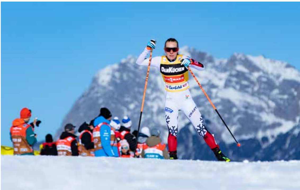
Seefeld 2026.

I FIS er det omfattende system med komiteer. De fleste av disse møtes til såkalte vårmøter og høstmøter og diskuterer alle temaer innenfor skiidretten som regelverk, anlegg, rekruttering, arrangementsutvikling og sikkerhet. Norge og alle store Ski-nasjoner er representert i de fleste av disse komiteene med en blanding av profesjonelt ansatte og frivillige. I alt er mer enn 1.000 medlemmer i forskjellige komiteer. I FIS pågår det nå en