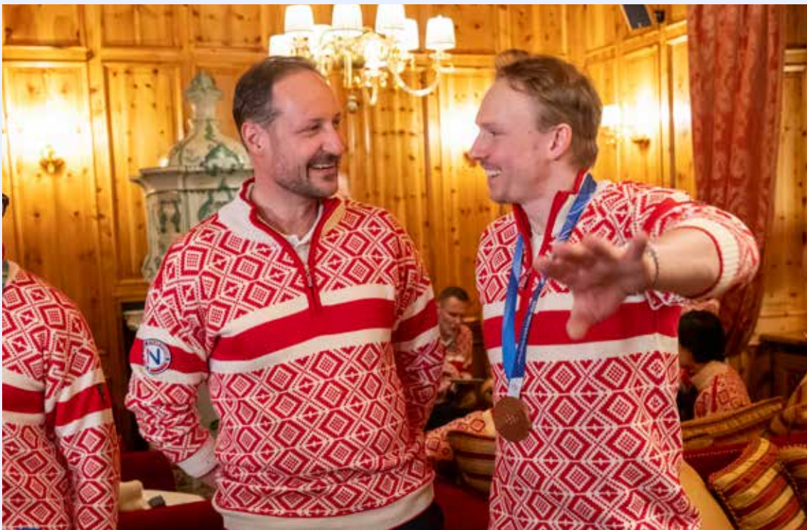
Kronprins Haakon møtte bronsevinner Henrik Kristoffersen på de norske alpinistenes hotell i etter slalåmrennet i Bormio under OL i Milano Cortina 20226.

Årsresultatet for 2025 endte med et overskudd på 1 million kroner.