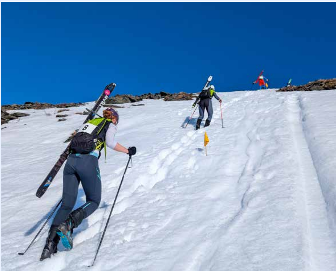
Bardu Rando.

En stor andel av budsjettet går til bredde og rekruttering gjennom prosjektet Randonee – økt lokal aktivitet, støttet av Sparebankstiftelsen DNB. Det er sendt søknad om videreføring av prosjektet, og disse midlene er avgjørende for å kunne opprettholde og videreutvikle rekrutteringsarbeidet. Rekruttering er en nøkkelfaktor for randonees videre utvikling. Olympiatoppen er en viktig samarbeidspartner, både faglig og økonomisk. Randonee har vært en prioritert idrett inn mot OL 2026, og er i tillegg en del av Olympiatoppens langsiktige utviklingsprosjekt frem mot 2027.