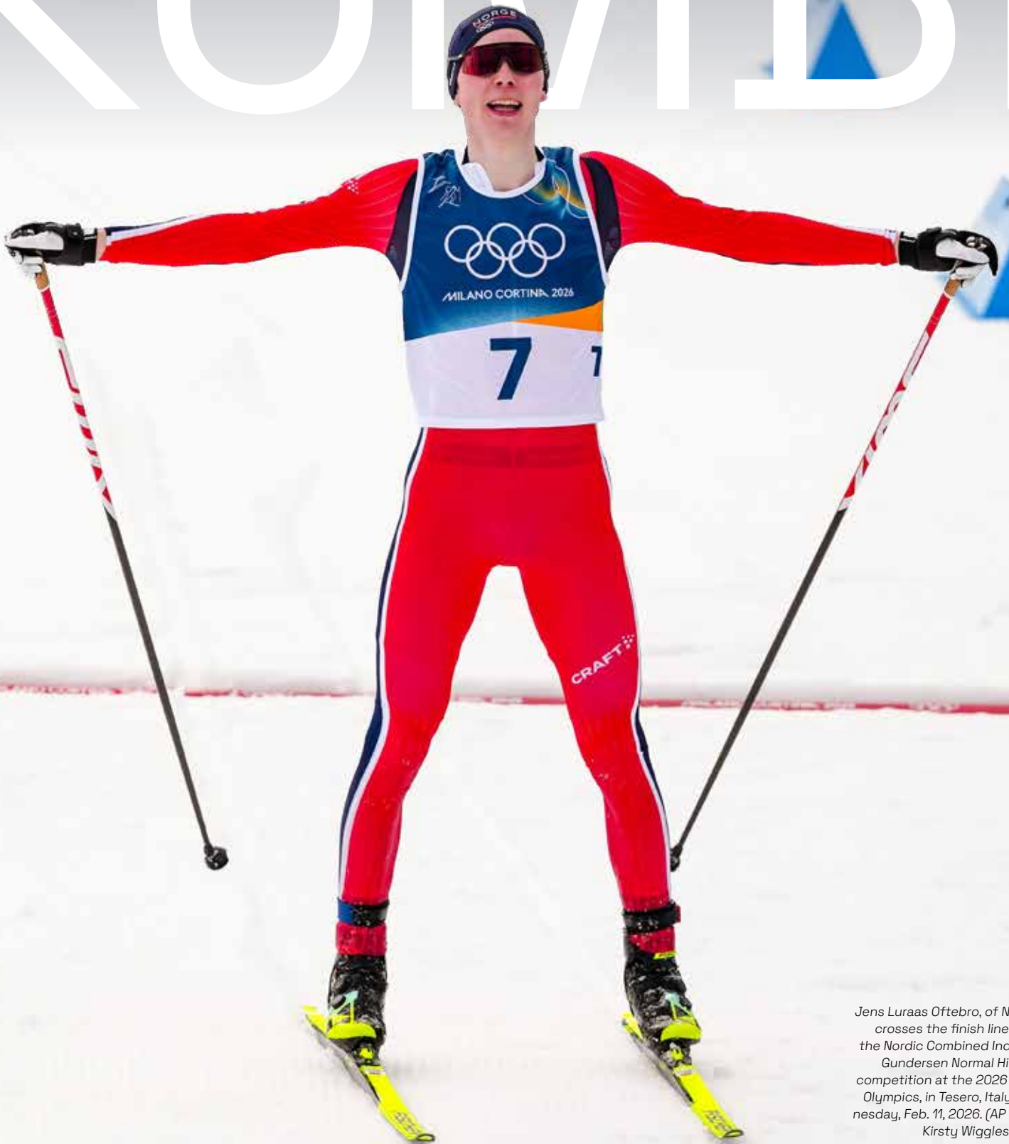
Jens Luraas Oftebro, of Norway, crosses the finish line to win the Nordic Combined Individual Gundersen Normal Hill/10km competition at the 2026 Winter Olympics, in Tesero, Italy, Wednesday, Feb. 11, 2026.