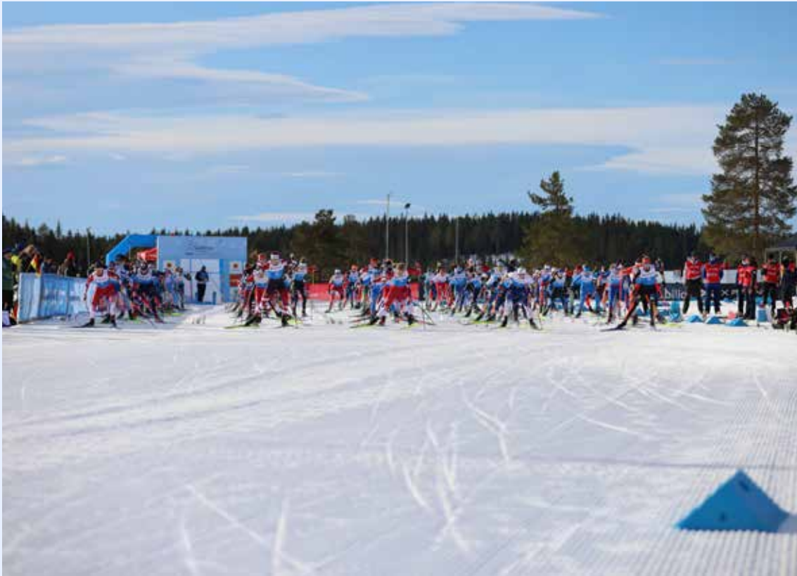
Starten 20 km kvinner i junior-VM Lillehammer.