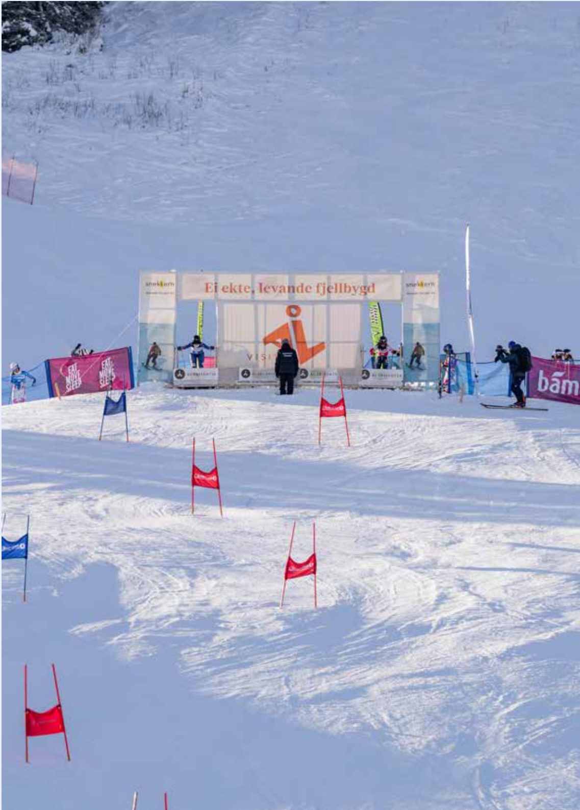
World Cup i telemark i Ål ble både en flott og en kjølig opplevelse for verdenseliten.