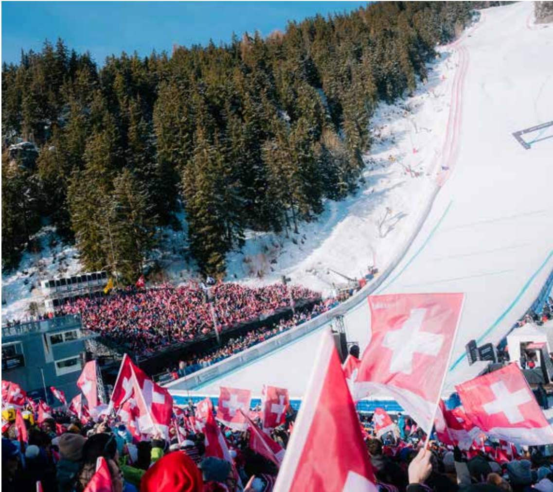
Crans Montana, Sveits.